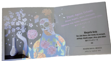
宣伝印刷物部門 経済産業大臣賞 『ブラックライトカクテルメニュー』 長瀬印刷(株) / 福島県支部