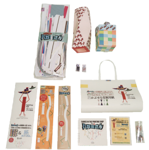
開発・開拓部門 厚生労働大臣賞 『ハガミさん』 (株)クリエイティブ横浜 / 神奈川県支部