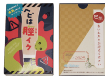
業務用印刷物部門 厚生労働大臣賞 『年賀状が、ヘビをテーマにしたカードゲーム!?' (株)ガリバー / 神奈川県支部